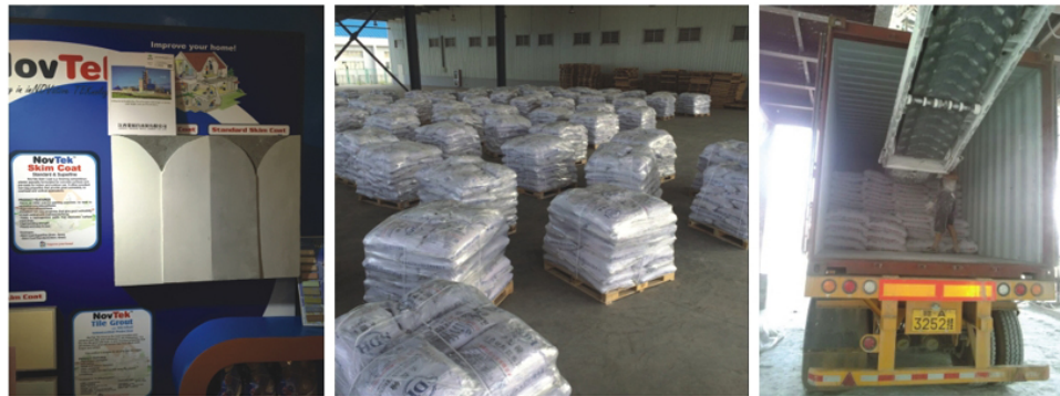
▲ 原材料水洗净化系统