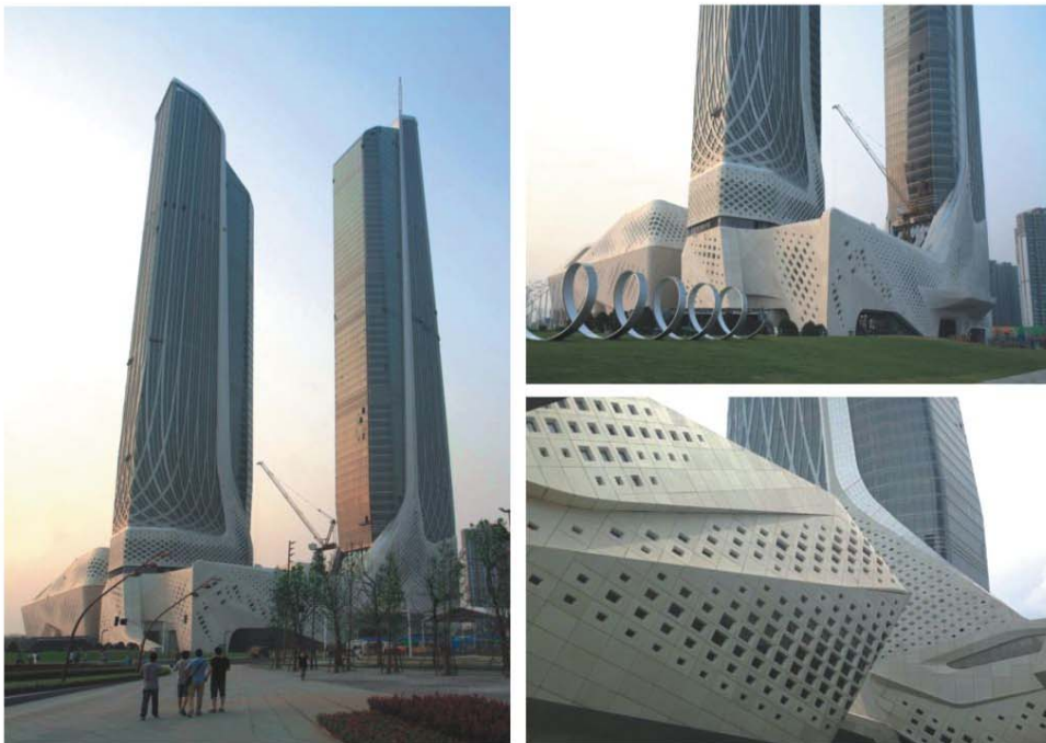
● 南京青奥会主会场 (应用银杉白水泥)