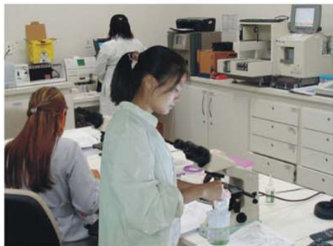
▲ 质量控制及研发中心