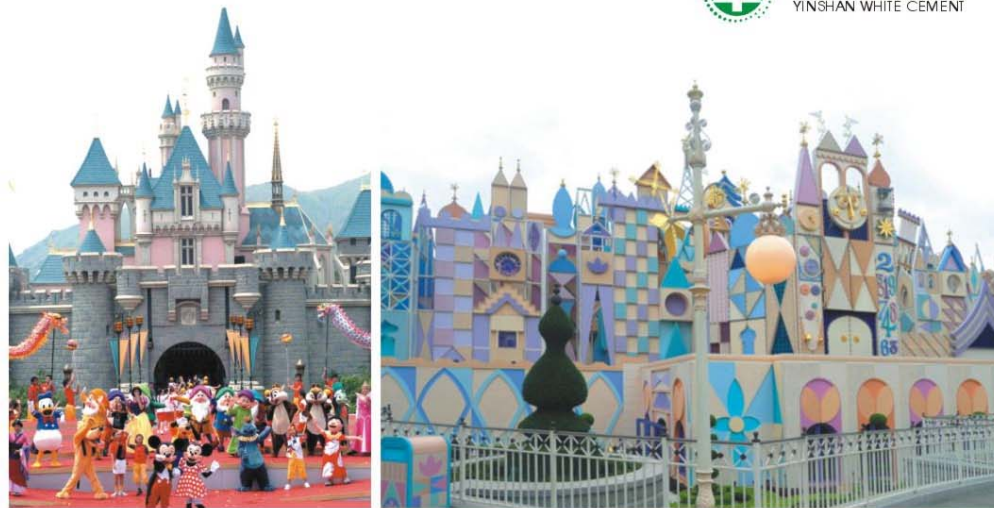
● 上海迪斯尼游乐园 (应用银杉白水泥)