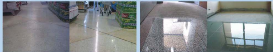
超市水磨石与水晶渗硅地面前后对比图